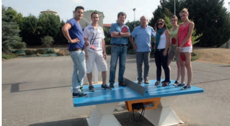
Plateau Resitec HD 60